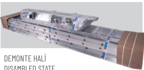
DEMONTÉ HALI DISASSEMBLED STATE